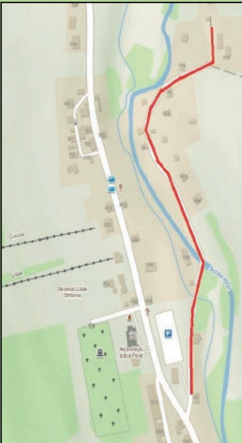
Lokalita Pod poštou - kanalizace