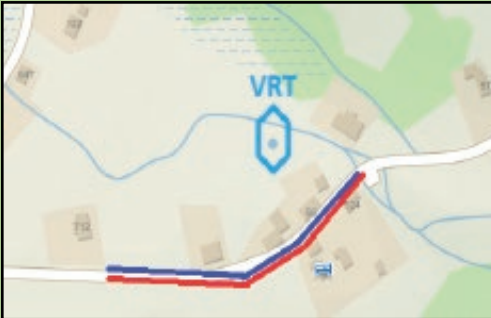
Lokalita Vrt - vodovod a kanalizace