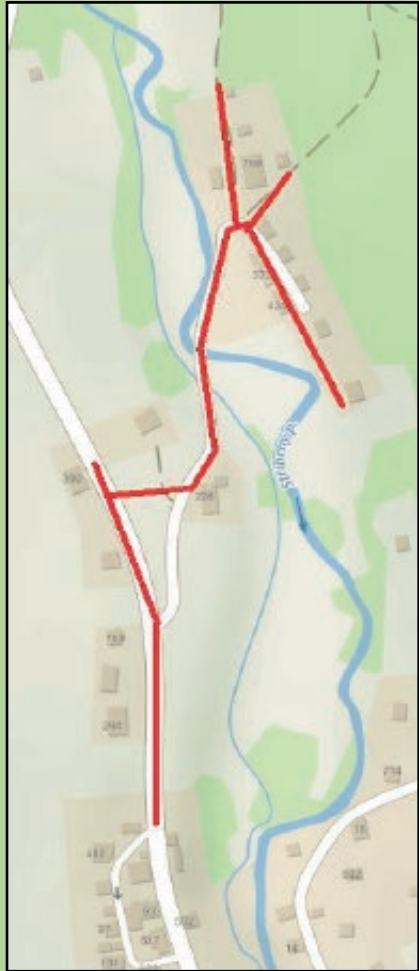
Lokalita Amerika - kanalizace